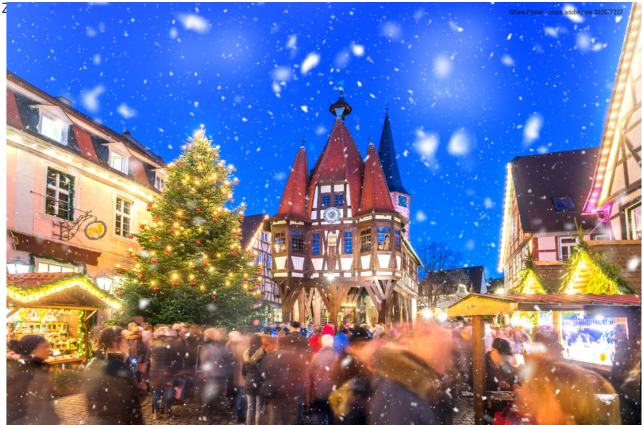
Weihnachtsmarkt in Michelstadt

Und heute ist es uns allen offenbar: Der Einzelhandel hat seine Funktion als Frequenzbringer für die Zentren verloren. Der Handelsverband Deutschland (HDE) Standortmonitor zählte zwischen 2010 und 2019 39.000 Geschäftsaufgaben von stationären Einzelhändlern in deutschen Innenstädten. Und in diesem Jahr sind leere Schaufenster von großen Filialisten in Bestlagen von Großstädten auch in wirtschaftsstarken Regionen wie Frankfurt/Rhein/Main oder Rhein-Neckar keine Seltenheit mehr. Das alles ist aber nicht nur Folge von Corona, sondern auch von einem stetigen Anstieg des Onlinehandels. Bis 2024 prognostiziert das Institut für Handelsforschung an der Universität zu Köln (IFH) einen Anteil des Onlinehandels am Einzelhandelsumsatz von 16,5 bis 19,4 Prozent. In Euro ausgedrückt könnte der Onlinehandel Umsätze zwischen 120 und 141 Milliarden pro Jahr erwirtschaften (vgl. Branchenreport Onlinehandel 2020). Im Jahr 2020 waren es noch 83 Milliarden Euro, 20 Jahre davor weist die Statistik lediglich eine Milliarde Euro Einzelhandelsumsatz im Onlinehandel aus (vgl. Statista). Es geht also nicht mehr um die Frage, ob das ein oder andere neue Gastronomiekonzept reicht, um Frequenz in den Ortskernen zu erzeugen, und ob diese Frequenz auch den Gastronomen reicht, um die bis dato sehr teuren Mieten in den 1A-Lagen zu zahlen. Wir reden über etwas Grundsätzlicheres: Wir müssen die Innenstadt neu erfinden, und zwar gemeinsam!