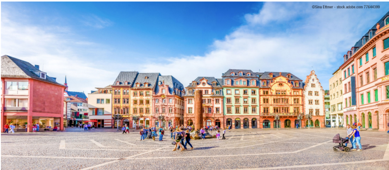
Mainz, Domplatz

In diesem Reallabor Innenstadt muss nicht jede Idee und jeder kleine Umbau gleich für die Ewigkeit sein. Ganz im Gegenteil: Filialisierte Einkaufsstraßen zeigen uns, wenn wir ehrlich sind, schon lange, dass diese Art Stadt oder Ortszentrum ausgedient hat. Wir empfinden es heute wenig städtebaulich attraktiv, überall gleich und wenig kreativ. Dass dieser Reallabor-Charakter bereits heute und auch in kleinen, ländlichen Strukturen greifen kann, wissen wir schon länger. Pop-up-Stores oder Pop-up-Gastronomie finden in Leerständen oder attraktiven städtebaulichen Nischen ihren Platz, und vor allem auch Kund*innen. Die Konzepte funktionieren und locken auch Gäste aus den Großstädten „aufs Land“, wie Beispiele aus Erbach und Michelstadt im Odenwald mit Pop-up-Biergärten oder -Museen eindrucksvoll unter Beweis gestellt haben. Aber auch tradiert daher kommende Standort- oder Werbegemeinschaften müssen nicht immer antiquar sein, und eine Einkaufsstraße kann auch heute noch funktionieren. Im Fall der Schulstraße in Darmstadt kann man sehen, wie Tradition und Moderne hervorragend nebeneinander funktionieren. Für Tradition stehen einfache, aber handwerklich hervorragende regionale/saisonale Gastronomie, Bioläden und Bäcker oder auch ein Fahrradladen. Für Moderne stehen Sneakerläden und hochwertige, ausgewählte und natürliche Männerpflegeprodukte.