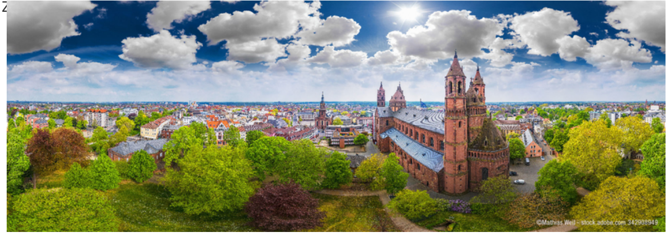
Dom St. Peter zu Worms