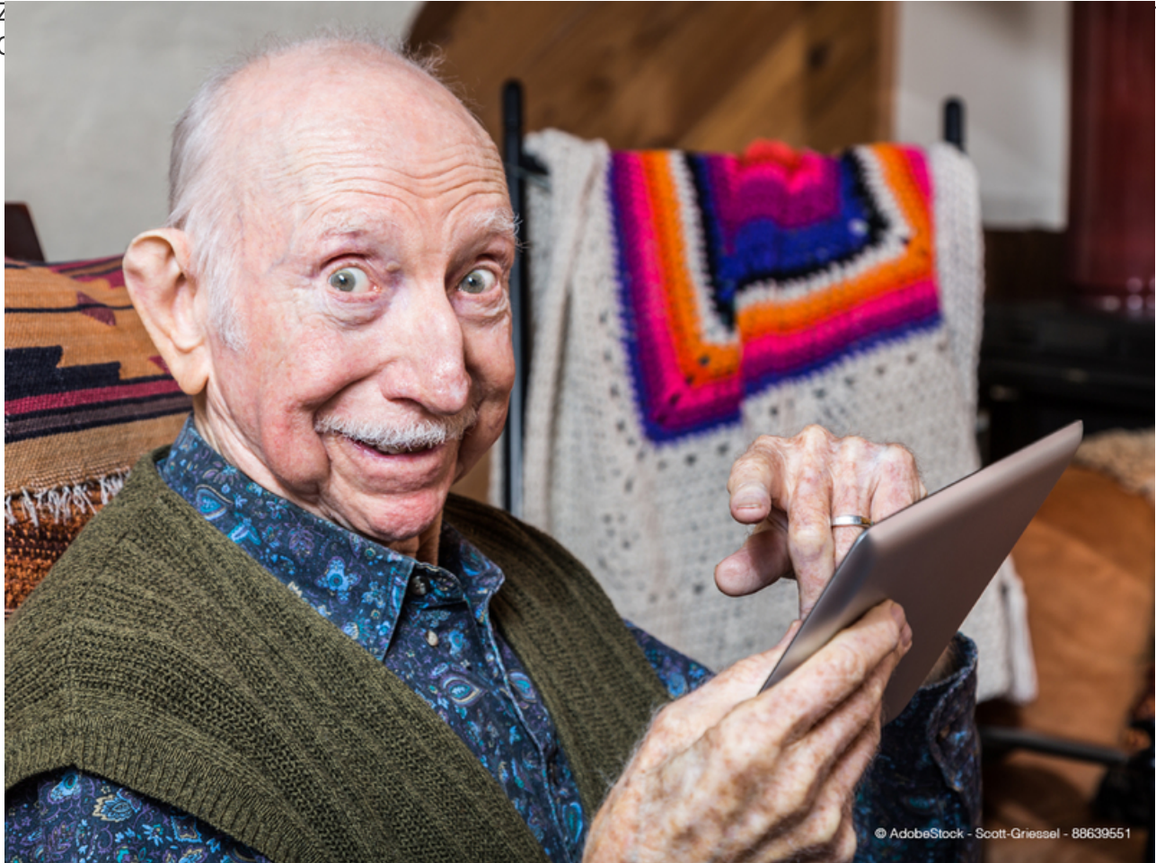
Kontakt halten mit digitalen Medien kann sich nicht jeder leisten.