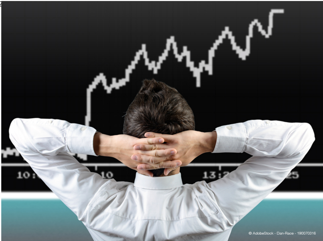
Hedgefonds und Finanzkonglomerate profitieren von der Krise.