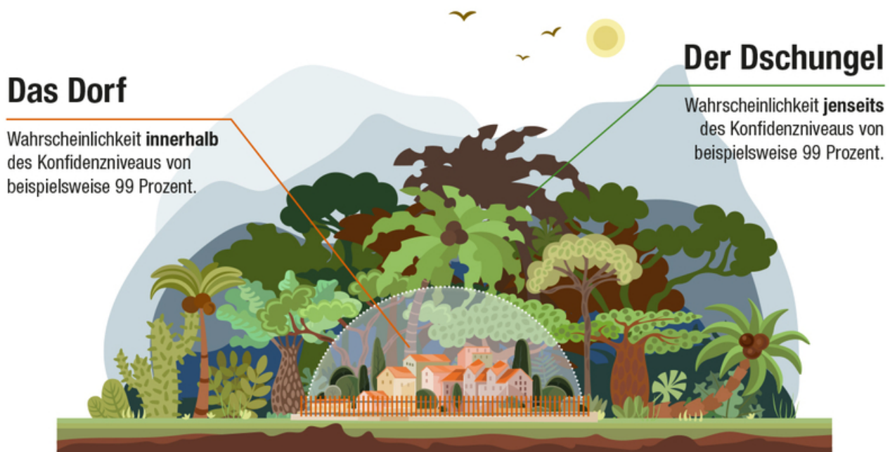
Abbildung 01: Die Metapher von Dorf und Dschungel

Quelle: Frank Romeike in Anlehnung an GARP 2008 (Text) / Oxana Kopyrina, kirasolly – AdobeStock (Abbildung) / Design: Magascreen.com