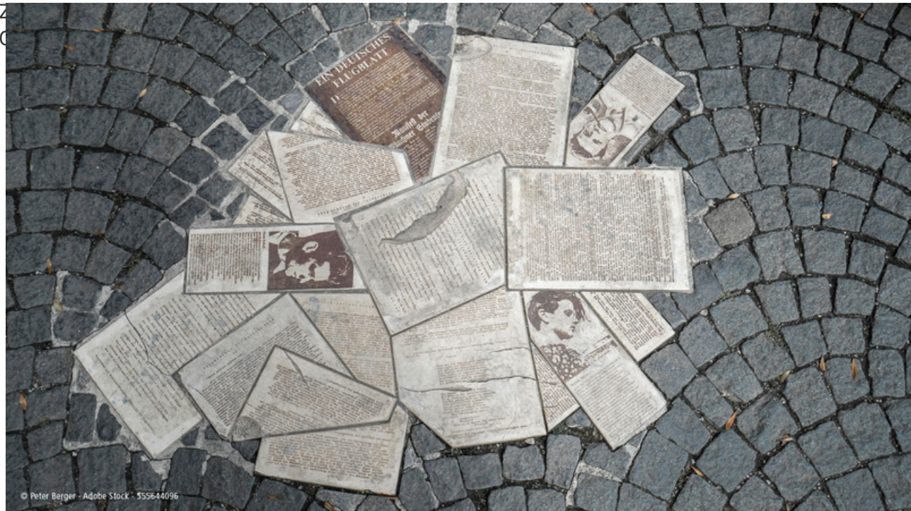
Mahnmal an die Flugblattaktion der Widerstandsgruppe „Weiße Rose“ um die Geschwister Scholl vor der Ludwig-Maximilian-Universität in München

Dies wird noch deutlicher in Bonhoeffers Ausführungen zur freien Tat, mit der er die Zivilcourage verbindet. „Ohne Rückendeckung durch Menschen, Umstände oder Prinzipien ... handelt der Verantwortliche in der Freiheit des eigenen Selbst ... in der allein und gänzlich befreienden Bindung an Gott und den Nächsten“ (Bonhoeffer 1992, 284). Es ist die Befreiung zur Verantwortung, die Christinnen und Christen auszeichnet. Dies umfasst auch zivilcouragiertes Handeln, das zivilem Ungehorsam zugrunde liegt. Zugleich ist Bonhoeffer kein Michael Kohlhaas, der sich nach der Devise Fiat iustitia et pereat mundus! und ohne Rücksicht auf Verluste die Bahn bricht.