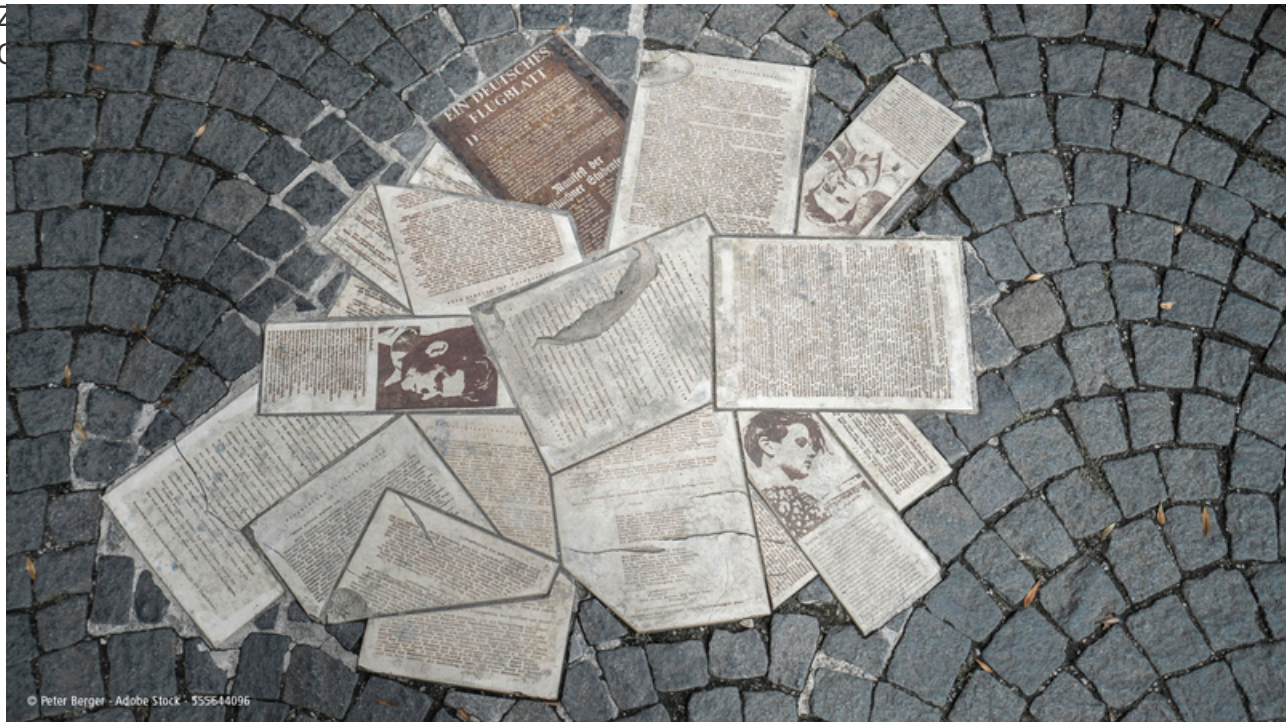
Mahnmal an die Flugblattaktion der Widerstandsgruppe „Weiße Rose“ um die Geschwister Scholl vor der Ludwig-Maximilian-Universität in München

Dies wird noch deutlicher in Bonhoeffers Ausführungen zur freien Tat, mit der er die Zivilcourage verbindet. „Ohne Rückendeckung durch Menschen, Umstände oder Prinzipien ... handelt der Verantwortliche in der Freiheit des eigenen Selbst ... in der allein und gänzlich befreienden Bindung an Gott und den Nächsten“ (Bonhoeffer 1992, 284). Es ist die Befreiung zur Verantwortung, die Christinnen und Christen auszeichnet. Dies umfasst auch zivilcouragiertes Handeln, das zivilem Ungehorsam zugrunde liegt. Zugleich ist Bonhoeffer kein Michael Kohlhaas, der sich nach der Devise Fiat iustitia et pereat mundus! und ohne Rücksicht auf Verluste die Bahn bricht.